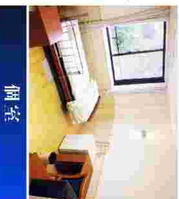
※建設中のため、写真はイメージとなります。

お客様（入居者）に生きる喜びや喜びを感じて頂く為に、介護をする、される側という関係ではなく、一緒に “人生の今を生きている” ことを共有したいと考えております。なによりもお客様がどうしたいか、どう暮らしたいかという気持ちを尊重し、ケアを生活援助として位置付けております。